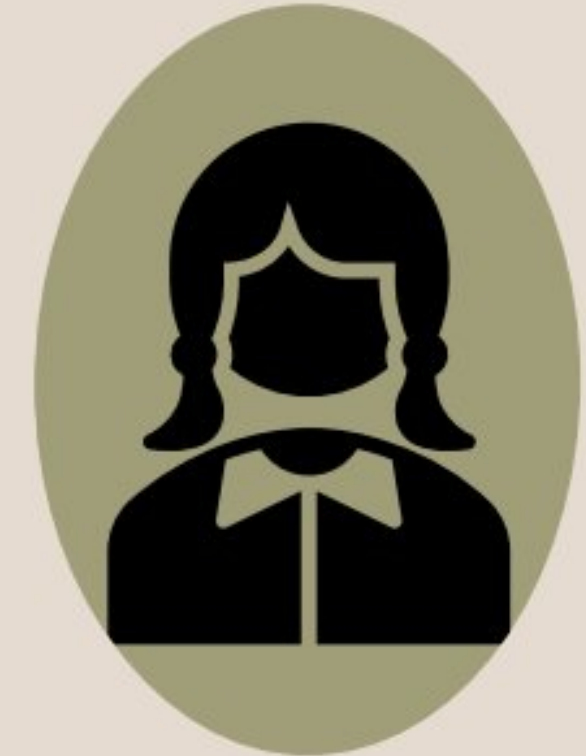
زهرا وکیل دبیر جامعه شناسی دهم